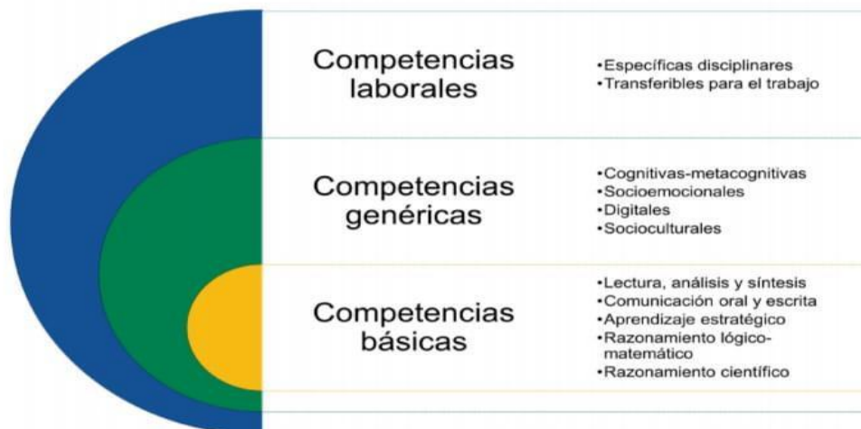
Figura del Modelo Universitario 2020.

El MU (2020) contempla para la formación, la mediación formativa, que son las estrategias y acciones de intervención para favorecer aprendizajes, competencias y formación.